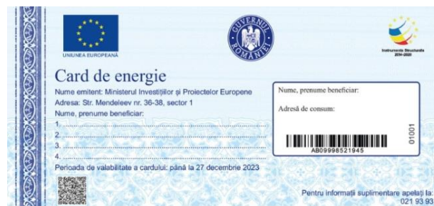
Fig.1. Exemplu - cardul de energie

Valabilitatea cardului de energie ? Sumele alocate pe Cardul de energie trebuie utilizate până la data de 31 martie 2024 . După această dată sumele vor deveni inutilizabile, fără posibilitatea recuperării acestora.