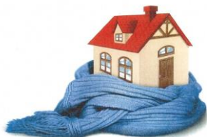
Fig.4. Ajutor pentru încălzire

Veniturile bănești se vor cumula cu alte tipuri de venituri materiale. Prin urmare, la completarea cererii, titularul ajutorului are obligația de a transmite corect toate informațiile solicitate privind componența familiei, veniturile membrilor acesteia, precum și bunurile mobile și imobile deținute.