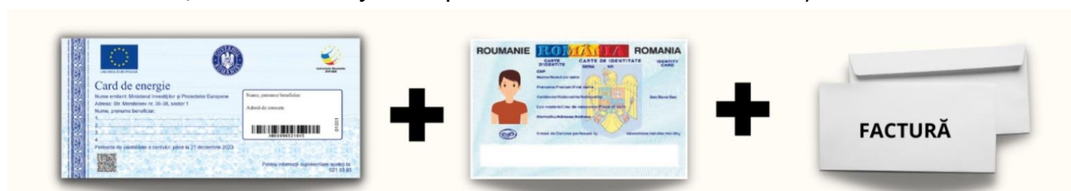
Fig.2. Parcursul plății

Dacă beneficiarul are alt domiciliu decât cel scris pe cardul de energie, sunt necesare contractul de furnizare a energiei la domiciliul declarat și o declarație pe proprie răspundere a beneficiarului, că utilizează ajutorul pentru domiciliul la care locuiește.